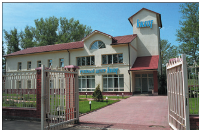
Учебный центр КНАУФ в Новомосковске