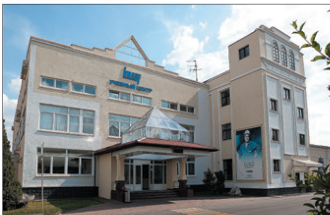
Учебный центр КНАУФ в Красногорске

Несколько иной уровень сотрудничества компании с вузами – консультационные центры. Там мы не только обучаем студентов, но и проводим экспериментальные исследования, сопровождаем проектную деятельность магистрантов, аспирантов и молодых преподавателей. Совместно с вузами мы также реализуем и точечные проекты, например по подготовке студентов к работе в стройотрядах, – эти ребята потом участвуют в строительстве крупных объектов, таких как космодром Восточный, объекты инфраструктуры тепловой и атомной отраслей.