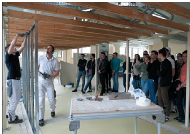
Учебная практика студентов МГСУ

В настоящее время вся образовательная деятельность сосредоточена в Академии КНАУФ. Разрабатываются и внедряются стандартные программы обучения, которые соответствуют различным комплексным системам КНАУФ. Каркасно-обшивным комплексным системам КНАУФ (подвесные потолки, перегородки и облицовки) отвечает программа обучения «Сухое строительство»; применению штукатурных и шпаклевочных составов КНАУФ обучает программа «Сухие смеси» и т. д. Также созданы специальные программы, например «Типичные ошибки при отделочных работах» или курс по криволинейным поверхностям, которые пользуются большой популярностью. По заказу потребителя можно быстро собрать учебную программу из базовых модулей, как конструктор. Например, программа для бригадиров-отделочников подготовлена совместно с коллегами из ведущих строительных вузов и включает не только блоки по материаловедению и технологиям, но и правила организации работы звена отделочников.