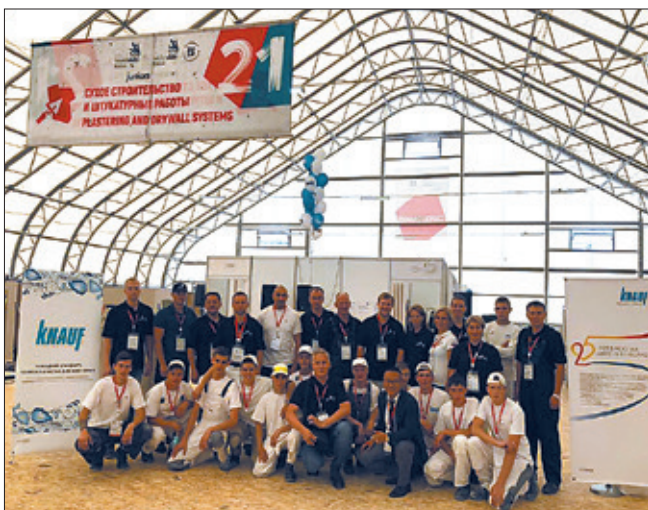
Участники финала VI Национального чемпионата «Молодые профессионалы» (Worldskills Russia) в компетенции «Сухое строительство и штукатурные работы»

В 1993 г. компания КНАУФ фактически стала родоначальником профессии мастер сухого строительства в России, которая в настоящее время называется монтажник каркасно-обшивных конструкций. Если профессия штукатур из советских классификаторов профессий органично была перенесена в российские, то профессии монтажник каркасно-обшивных конструкций в советское время не существовало. Соответственно, придя в Россию, компания КНАУФ стала работать в том числе и над легитимацией этой профессии. Был создан первый профессиональный стандарт специалиста сухого строительства – профессия была утверждена 5 марта 2004 г. Стандарт предполагал восемь квалификационных уровней, охватывающих начальное, среднее, высшее и дополнительное образование, а его создание отражало позицию поддержки Болонского процесса. Затем этот профессиональный стандарт был интегрирован в систему образования. По инициативе КНАУФ был разработан образовательный стандарт «Мастер сухого строительства».