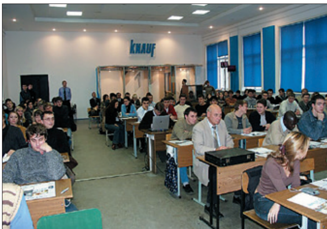
Семинар в учебном центре КНАУФ Красногорск

В настоящее время вся образовательная деятельность сосредоточена в Академии КНАУФ. Разрабатываются и внедряются стандартные программы обучения, которые соответствуют различным комплексным системам КНАУФ. Каркасно-обшивным комплексным системам КНАУФ (подвесные потолки, перегородки и облицовки) отвечает программа обучения «Сухое строительство»; применению штукатурных и шпаклевочных составов КНАУФ обучает программа «Сухие смеси» и т. д. Также созданы специальные программы, например «Типичные ошибки при отделочных работах» или курс по криволинейным поверхностям, которые пользуются большой популярностью. По заказу потребителя можно быстро собрать учебную программу из базовых модулей, как конструктор. Например, программа для бригадиров-отделочников подготовлена совместно с коллегами из ведущих строительных вузов и включает не только блоки по материаловедению и технологиям, но и правила организации работы звена отделочников.