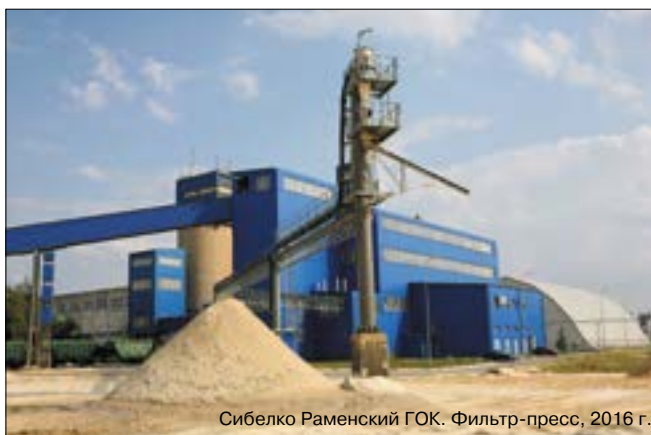
Сибелко Раменский ГОК. Фильтр-пресс, 2016 г.