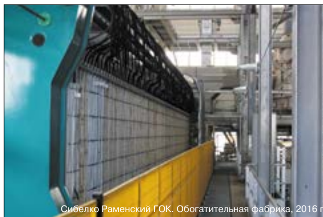
Сибелко Раменский ГОК. Обогащительная фабрика, 2016 г.